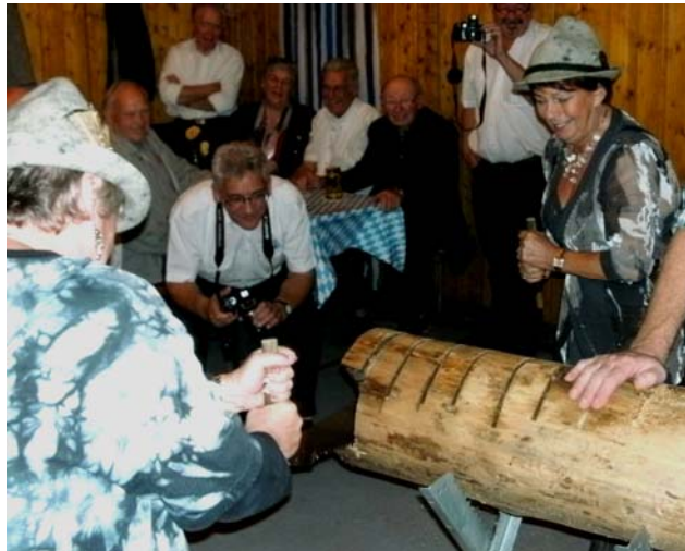
So wird das gemacht, ihr lieben Männer!

ergab sich daraus als konkretes Ergebnis ein gemeinsam mit den Niederländischen Sangesbrüdern gefeiertes zünftiges Oktoberfest in der Lourdeshütte.