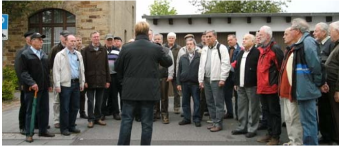
Ein Lied zu Beginn der Konzertreise

Nach einer Einführung bei RWE Power im Info-Zentrum Schloß Paffendorf ging es weiter zum Aussichtspunkt Angelsdorf am Tagebau Hambach, wo aus bis zu 370 Metern Tiefe Millionen Tonnen Braunkohle und Abraum gefördert werden.