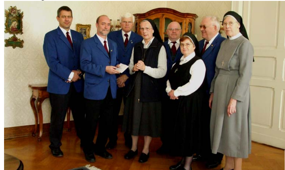
Große Freude im Kloster Calvarienberg bei der Spendenübergabe