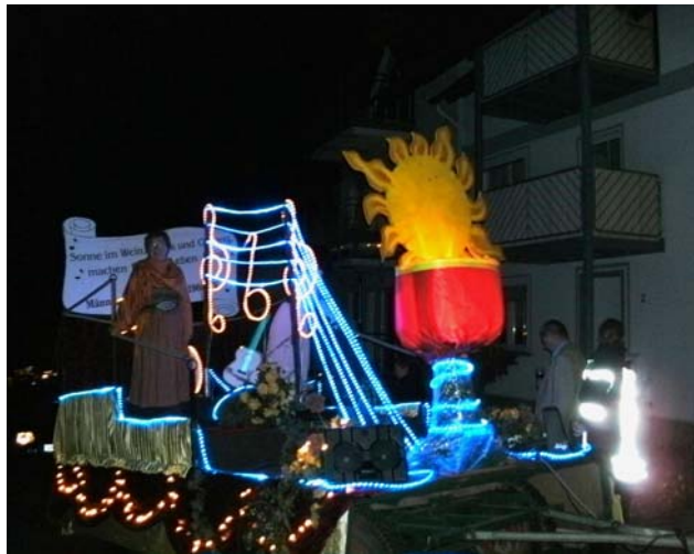
Der Wagen des MCB

Festwagen herfuhr und viel Begeisterung und Beifall erhielt.