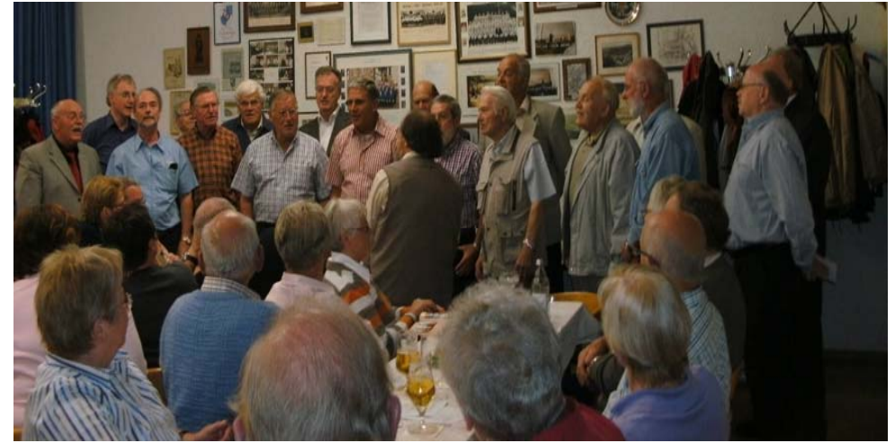
Der Chor singt für die Gäste aus Exter

An Wochenende vom 27.-29.8. machten uns die Mitglieder der Evangelischen