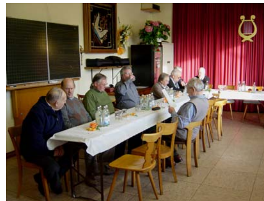
Die ersten Mitglieder sind schon da!

Zu ihrer turnusmäßigen Hauptversammlung trafen sich die Sänger an diesem