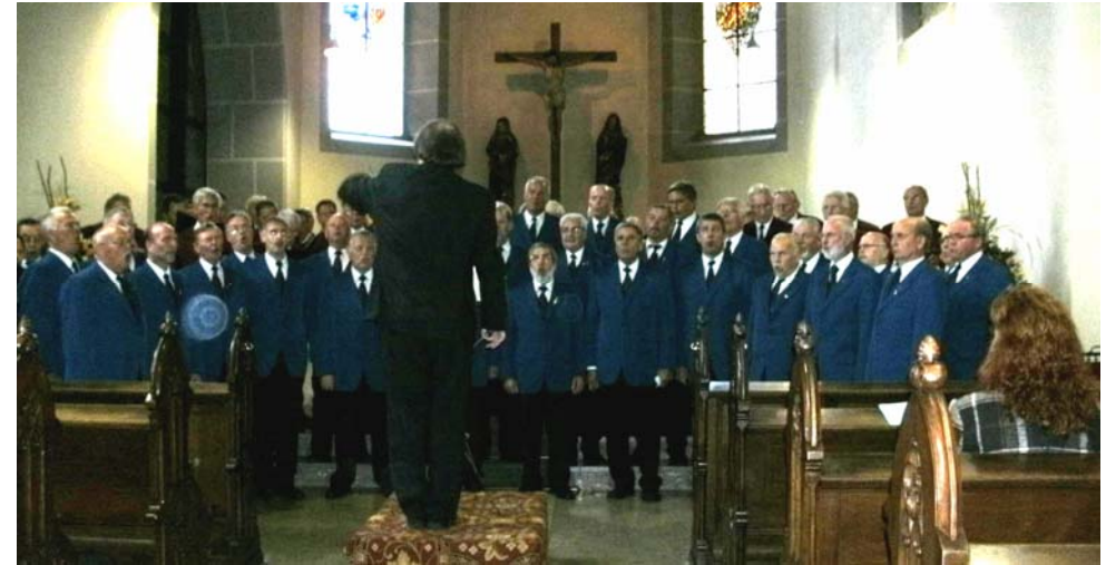
Gemeinsames Konzert mit dem Männerchor Potsdam im Kloster Calvarienberg