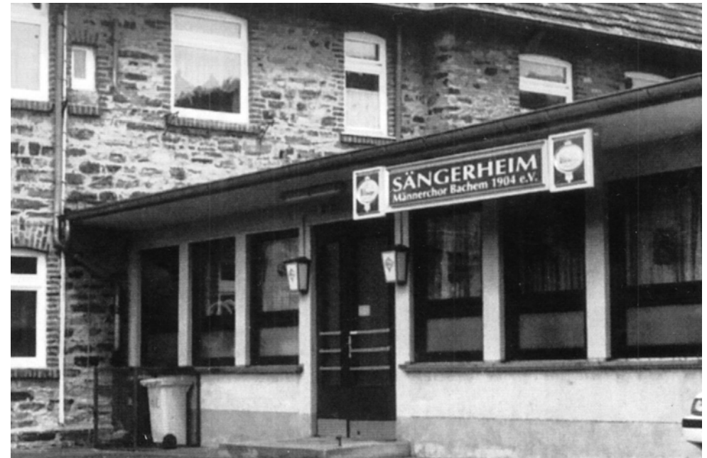
Das MCB-Sängerheim an der Alten Schule in Bachem

Das Glück eines eigenen Proberaumes währte aber nicht lange. Der Schulbetrieb zog wieder in die Schule ein und wir mussten die Chorprobe zukünftig im großen Saal des Winzervereins abhalten. Im Sommer war es erträglich. Im Winter wurde der Vorhang zugezogen und der Bühnenbereich so gut es ging anhand von Gasstrahlern beheizt. Ergebnis war: „Rücken sehr warm, Bauch kalt!“ Wir probten trotzdem weiter und waren zufrieden.