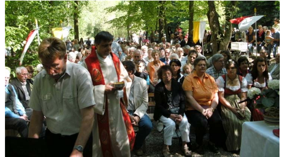
Die Messe am Pfingstmontag im Freien vor der Lourdes Kapelle