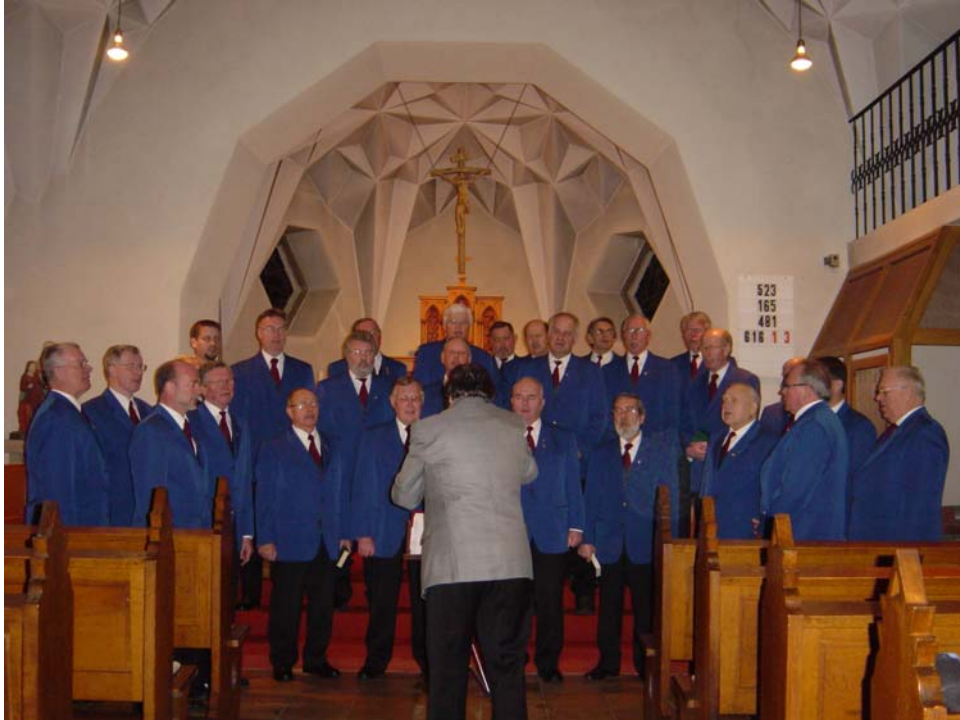
Der Chor singt bei der Messe in St. Anna