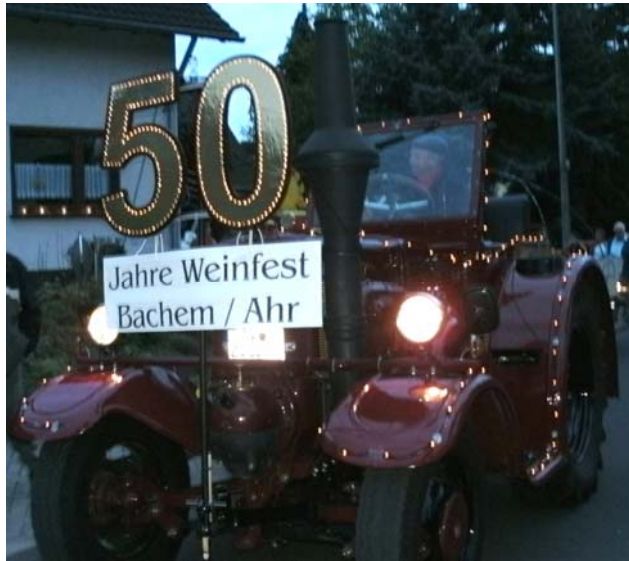
Ein Blickfang beim Lichterzug in Bachem