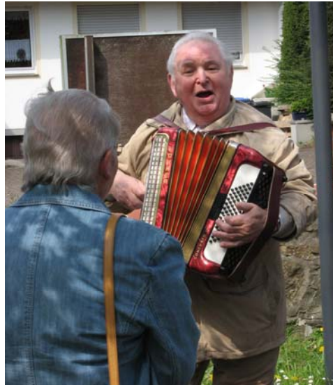
Der Mai ist gekommen, die Bäume schlagen aus