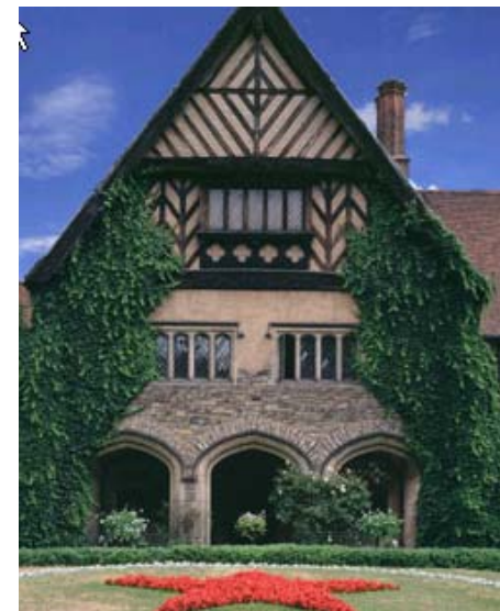
Schloß Cecilienhof mit Sowjetstern

Am Samstagvormittag war als erstes eine Besichtigung von Sanssouci vorgesehen. Wir fuhren wir an Schloß Charlottenhof, Neues Palais und der Orangerie vorbei und erreichten nach kurzem Fußweg die bekannte Windmühle und Schloß Sanssouci. Von der Schauseite des Schlosses bot sich ein herrlicher Blick über die Terrassen hinunter auf die Parkanlagen und von unten an der Fontaine wiederum den bekannten Blick auf das Schloß. Nach einem kleinen Rundgang durch die angrenzenden Parkanlagen, am Grab von Friedrich vorbei ging es zurück zum Bus zur Weiterfahrt nach Cecilienhof. Der Weg dorthin führte an schön renovierte Häuser der früheren Hofbeamten und an der Russischen Siedlung Alexandrowka vorbei. Schloß Cecilienhof liegt am Heiligensee inmitten der Havelseen-Landschaft und wurde von 1913 an in nur vier Jahren vom Kaiser für den Kronprinz Wilhelm und seine Gemahlin Kronprinzessin Cecilie errichtet. Das Haus mit seinen 174 Zimmern hat durch die Potsdamer Konferenz in 1945 mit Truman, Churchill und Stalin Berühmtheit erlangt. Noch heute wird hier zum Andenken in jedem Jahr der Sowjetstern im Garten mit roten Begonien bepflanzt – heute auf Kosten Rußlands. Nach einem letzten Gang durch das Holländer Viertel ging es zurück ins Hotel, um rechtzeitig zum Konzert am Nachmittag bereit zu sein.