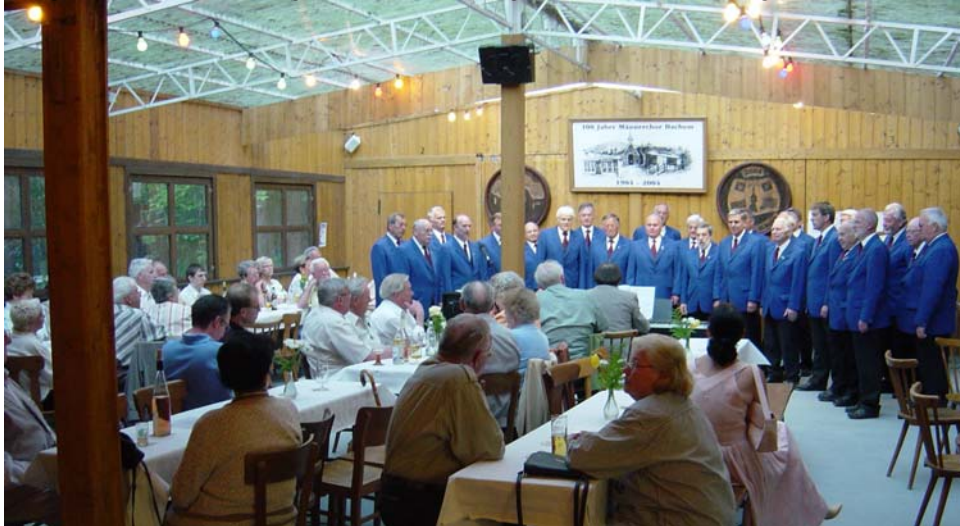
Der Bachemer Chor beim Rheinischen Sängereabend....

Wie in jedem Jahr begann das Waldfest am Pfingstsamstag mit dem Rheinischen Sängereabend. Seit 1954 gibt sich der Chor gastfreundlich und organisiert zum