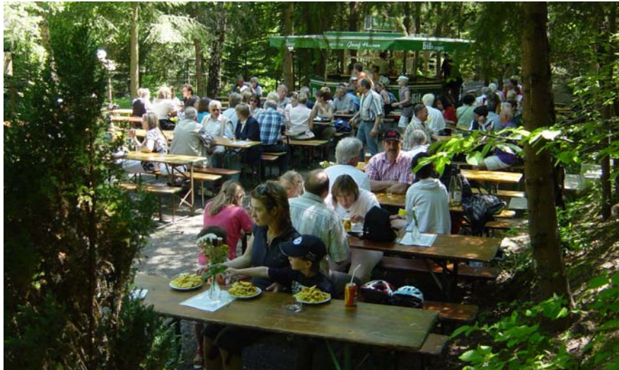
Frühschoppen bei Sonnenschein vor der Lourdeshütte