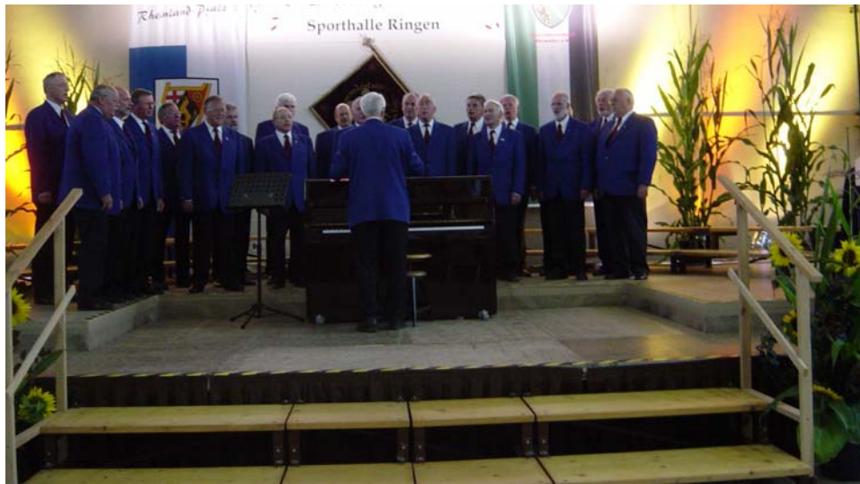
Singen beim Jubiläum vom Bölinger Liederkrantz