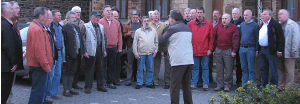
Die Konzertreise beginnt mit einem Morgenlied

Pünktlich um 6 Uhr am Himmelfahrtsmorgen startete der Männerchor mit 38 Teilnehmern (30 Sänger) zu seiner Konzertreise nach Potsdam. Die Koffer waren vorher in den Bus geladen und vor dem Einstieg verabschiedeten sich die Sänger traditionsgemäß mit dem Lied „Am kühlenden Morgen“.