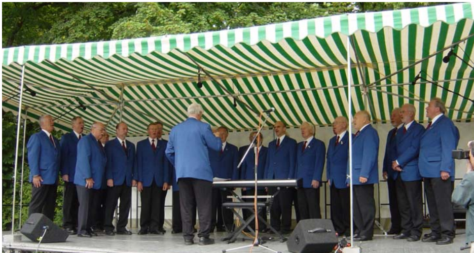
Chorfest in Köln-Rath