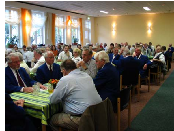
Nach dem Konzert im Sängerheim

Die Sitzordnung hatte sich zwar vorwiegend an der Chorzugehörigkeit orientiert, nach dem von allen Anwesenden aber als sehr gelungen empfundenen Verlauf des Konzerts ergaben sich schnell lockere Gespräche über die Tischgrenzen hinweg. Auch die hier von beiden Chören zwischendurch dargebotenen Liedvorträge hatten ihren Anteil an der fröhlichen und herzlichen Atmosphäre des Abends. Auf beiden Seiten äußerten viele den Wunsch, den Kontakt weiter zu pflegen und gemeinsame Treffen zu wiederholen.