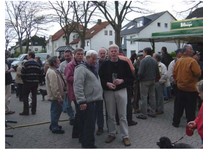
Wollen wir denn gar nichts singen?

Zahlreiche Besucher hatten sich wieder an diesem Abend vor dem 1. Mai auf dem Parkplatz an der Piusstraße zum Aufrichten des Maibaums eingefunden.