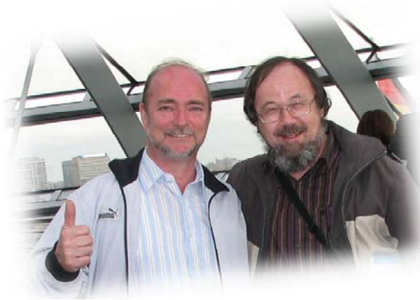
In der Reichstagskuppel: Die Führungskräfte des MCB

Abgerundet wurde der Abstecher nach Berlin mit dem Aufstieg auf der spiralförmigen Rampe der Reichstags-Kuppel bis hinauf zur Besucherterrasse. Sie bietet eine einmalige Aussicht über die ganze Stadt. Besonders die nahe Spree, das nur wenige Meter entfernte Brandenburger Tor, der Fernsehturm am Alex und die Hochhaus-Türme am Potsdamer Platz ließen sich gut überblicken.