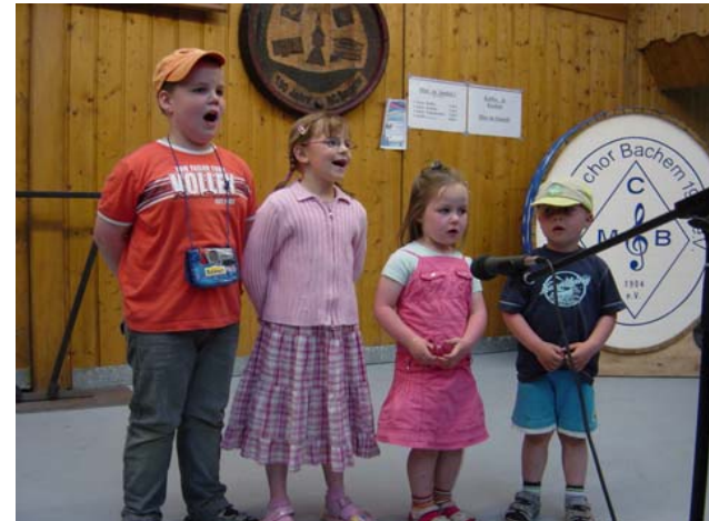
Sehr motiviert: die Sänger von morgen

Zur Überraschung der Besucher konnten sie am frühen Abend den Auftritt einer zukünftiger Sänger-Generation erleben. Vier Kinder aus der nahen Himmelsburger Straße hatten ihren ersten öffentlichen Auftritt. Unter der Anleitung von Frau