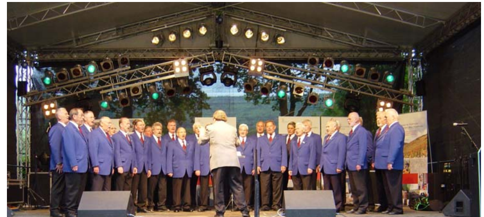
Auftritt auf dem Rheinland-Pfalz-Tag

Zum diesjährigen Rheinland Pfalz-Tag in Bad Neuenahr-Ahrweiler war ein öffentlicher Auftritt des Chors auf der Kommunalen Bühne im Lenné-Park eingeplant.