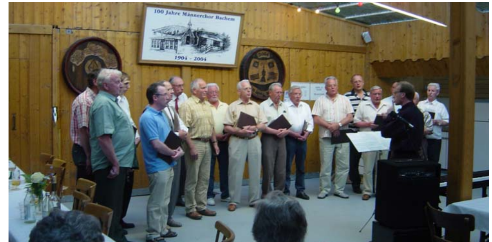
...und hier der Quartettverein Bengen in der Lourdes Hütte