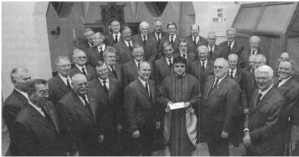
Nach der Messe in St. Anna

Es gehört bereits zum festen Bestandteil im Jahresprogramm des Chores: Die erste Messe in der Fastenzeit findet unter Mitwirkung des Männerchores statt und ist besonders den Chormitgliedern sowie