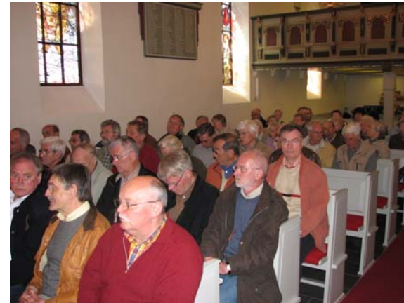
Die Kirche in Exter: gut gefüllt mit Sängern aus Bachem

Zu leichten Irritationen führte allerdings das Klingeln eines Mobiltelefons zu