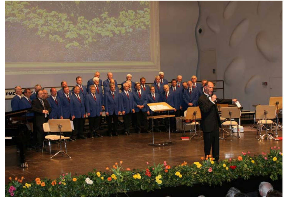
Der Männerchor Bachem im Nicolaisaal in Potsdam