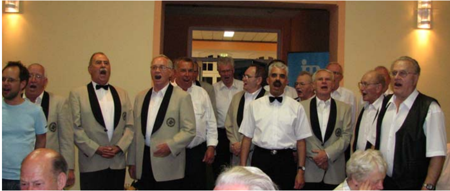
Der kleinere Teil des Potsdamer Männerchors beim Singen im Sängenheim

Für die Rückfahrt am Sonntag wählten wir eine südliche Route über Leipzig – Erfurt – Eisenach durch das landschaftlich reizvolle Thüringen, bereichert mit umfangreichen Informationen von Uwe Höllger zu den beiderseits der Fahrrouete zu sehenden Landmarken.