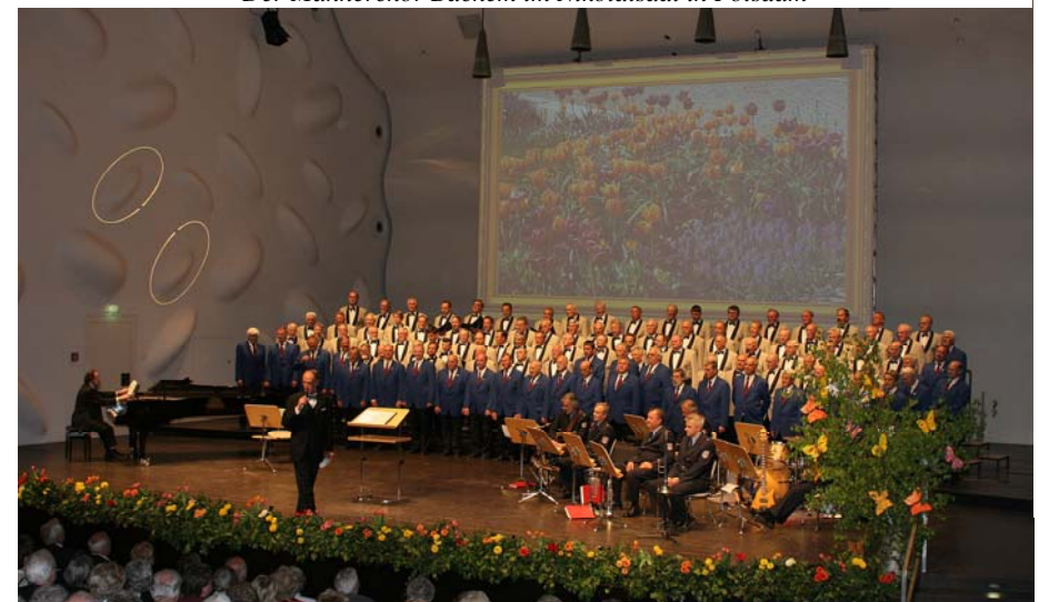
Gemeinsames Singen der beiden Männerchöre