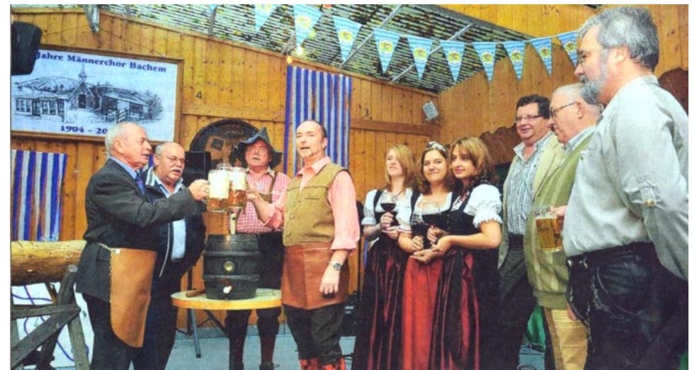
O'zapft is, das schäumende Bier im Krug

einem Glas Bachemer Rotwein, so erwiderten die Besucher dies mit einer Maß Münchner Bier.