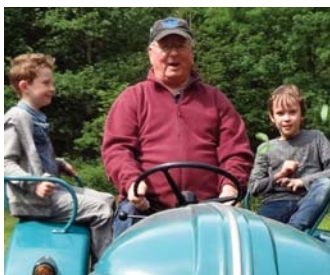
Traktorfahren macht immer Spaß