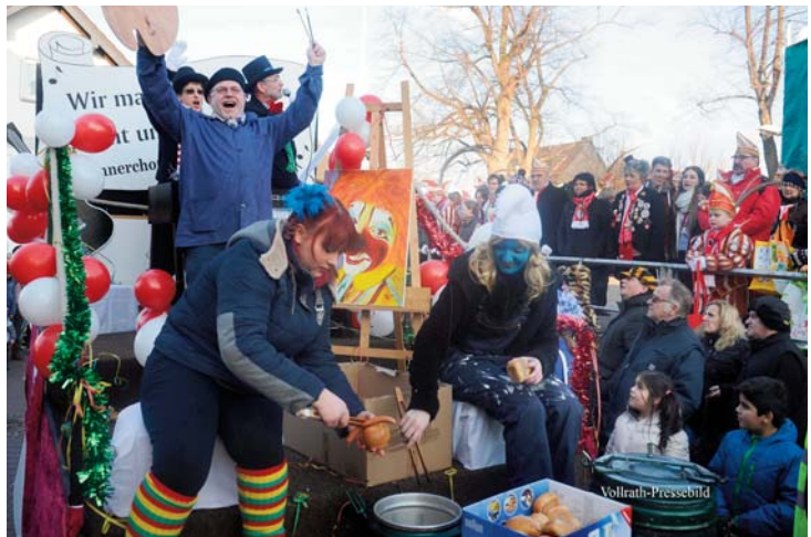
Unser Wagen voll im Bachemer Getummel

Denn besser kann man die gute Stimmung im Chor wohl nicht