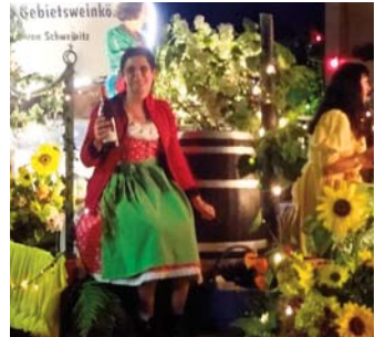
Unser Wagen wieder toll geschmückt und besetzt.