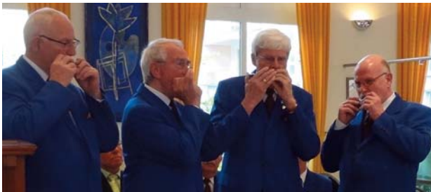
Respekt, das war ein toller Beitrag