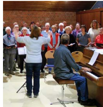
Geprobt wurde sehr ernsthaft, egal wo.

Nebenbei haben die Proben mit den anderen Chören auch noch ungemein Spaß gemacht. Es ist halt so: „Wer singt der findet zueinander“.