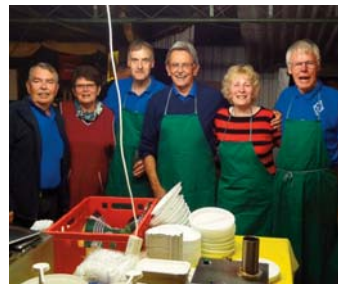
Nach einer harten Schicht in der Küche