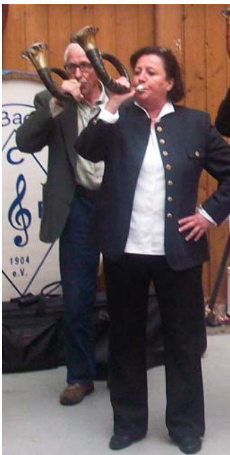
Die Jagdhornbläser gaben alles

Außenbereich, insbesondere als die Schlepperfreunde Rhein-Ahr mit ihren Traktoren vorführen. Gern waren sie bereit, Kindern unserer Gäste eine aufregende Mitfahrt durch das Bachemer Tal zu bieten.