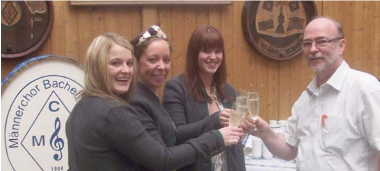
Die Bachehemer Majestäten