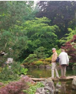
Sieht so der Garten Eden aus?