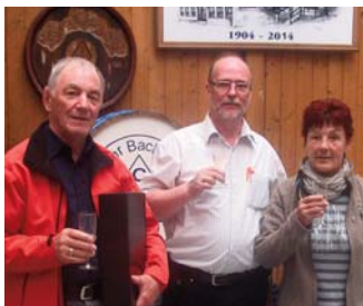
Habt Dank Ihr beiden,